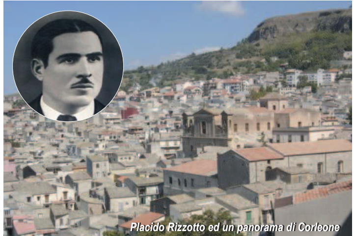
Placido Rizzotto ed un panorama di Corleone

caduti nel periodo tra il 1944 e il 1960. L'iniziativa per una legge che rendesse un minimo di giustizia a tanti dirigenti che non l'avevano avuta nelle aule dei tribunali fu riproposta durante la commemorazione fatta nel 1998 nel 50° anniversario dell'assassinio di Placido Rizzotto, tenuta a Corleone alla presenza del Segretario Generale della CGIL, Sergio Cofferati, i familiari di Rizzotto, le associazioni delle vittime "Non solo Portella" e la Fondazione Accursio Miraglia. Fu ripresa l'idea di una legge regionale che nel tempo era stata proposta dai Partiti della sinistra, ma mai approvata, per rendere onore ai caduti, sottolineare l'importanza di una pagina di storia non solo siciliana ma di tutto il Paese, e di un riconoscimento