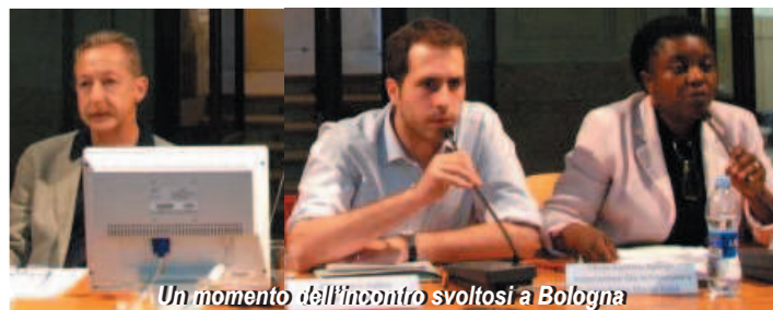
Un momento dell'incontro svoltosi a Bologna