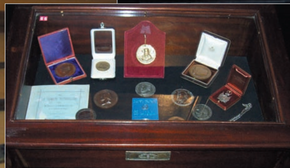
Nelle foto alcuni cimeli della collezione dello storico Francesco Romeo esposti al Palazzo Reale di Palermo