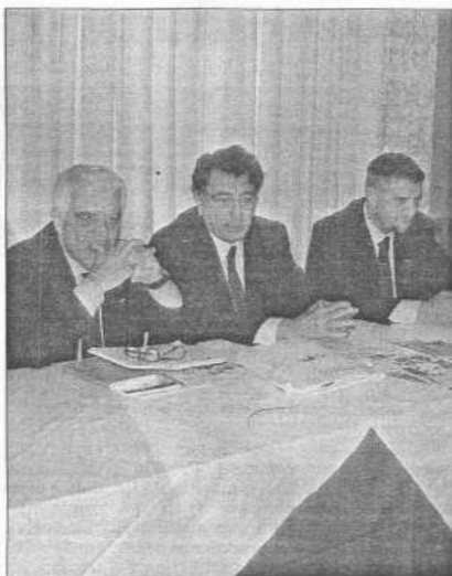
Alcuni dei relatori nel convegno di ieri mattina

lettuali e politici, tanto da farne emergere una figura di livello internazionale, attualissima, che giocò un ruolo di primo piano anche per gli italiani all'estero. Sull'illustre faentino si stanno concentrando le ricerche dell'Istituto italiano di studi storici "Fernando Santi", quale personaggio emblematico da valorizzare in occasione del 150° dell'Unità d'Italia.