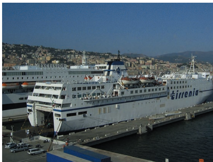
Il porto di Cagliari