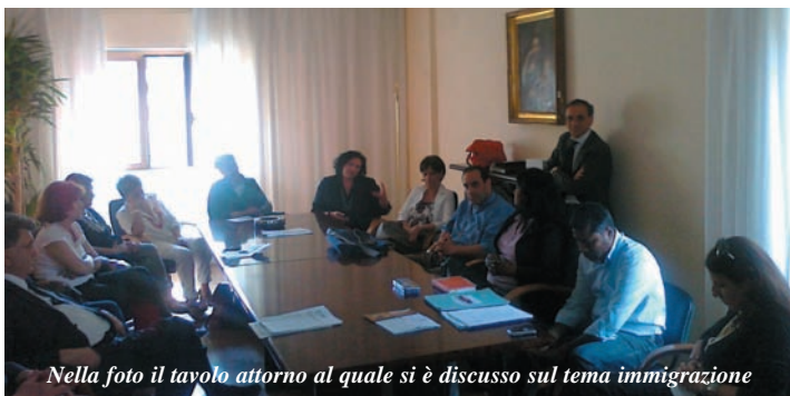
Nella foto il tavolo attorno al quale si è discusso sul tema immigrazione