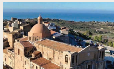
Panoramica del borgo agrigentino di Siculiana, in Sicilia

tradizione e accoglienza. Tra i requisiti per partecipare, oltre all'interesse per la cultura locale e la disponibilità a produrre contenuti digitali, figurava anche un elemento chiave per il cosiddetto turismo delle radici: il legame familiare o affettivo con la Sicilia. I candidati potevano infatti motivare la propria richiesta anche con il desiderio di ritornare nei luoghi di origine, per riscoprire la terra degli avi. Un criterio che ha reso l'iniziativa particolarmente attrattiva per i siciliani all'estero e per chi, pur vivendo altrove, conser-